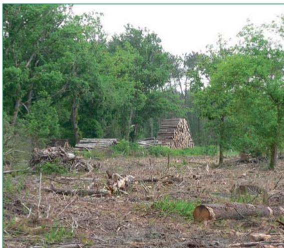
Parcelle sinistrée après nettoyage

C'est principalement la biodiversité ordinaire ou banale qui est visée par l'application de ce dispositif. On retrouve notamment dans cette définition les